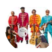
10.8. Herbs Beat Club