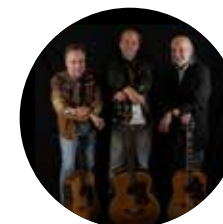
4.8. Sifting Sand