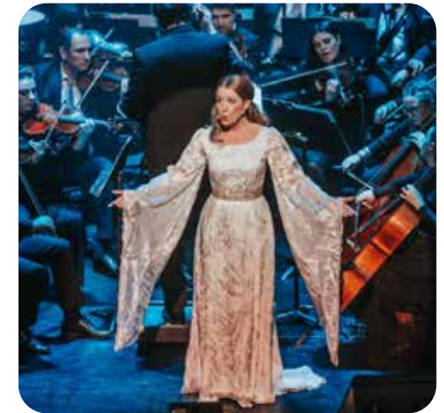
Herr der Ringe Orchester