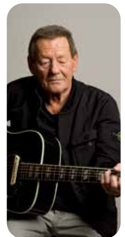
Wolfgang Ambros